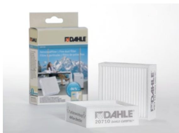
Fines filtres à particules Dahle 20710