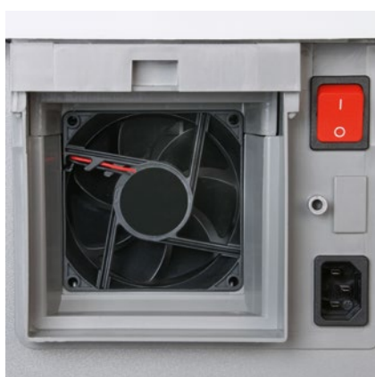
Un ventilateur performant aspire les particules de poussières fines à l'intérieur du destructeur de documents et les achemine vers le filtre